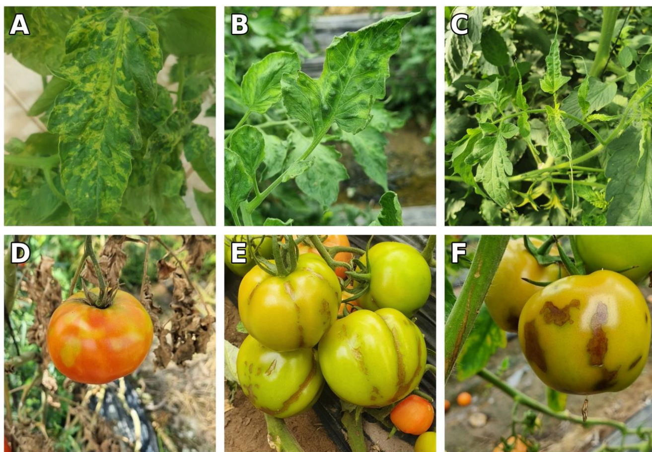
Figura 2. Síntomas del TOBRFV en tomate: (a–c) mosaico, deformación y clorosis foliar; (d–f) maduración irregular y manchas marrones necróticas en frutos.

(Lopez Lambertini, 2024). Esta dinámica de avance desagregada demuestra que el monitoreo reactivo resulta insuficiente si no se implementa previamente una estrategia rigurosa de exclusión. Por ello, es imperativo fortalecer las medidas de bioseguridad y diagnóstico temprano para interrumpir las vías de ingreso del patógeno y evitar los costos operativos y fitosanitarios asociados a la intervención sobre focos ya establecidos en puntos distantes de un país tan extenso como Argentina.